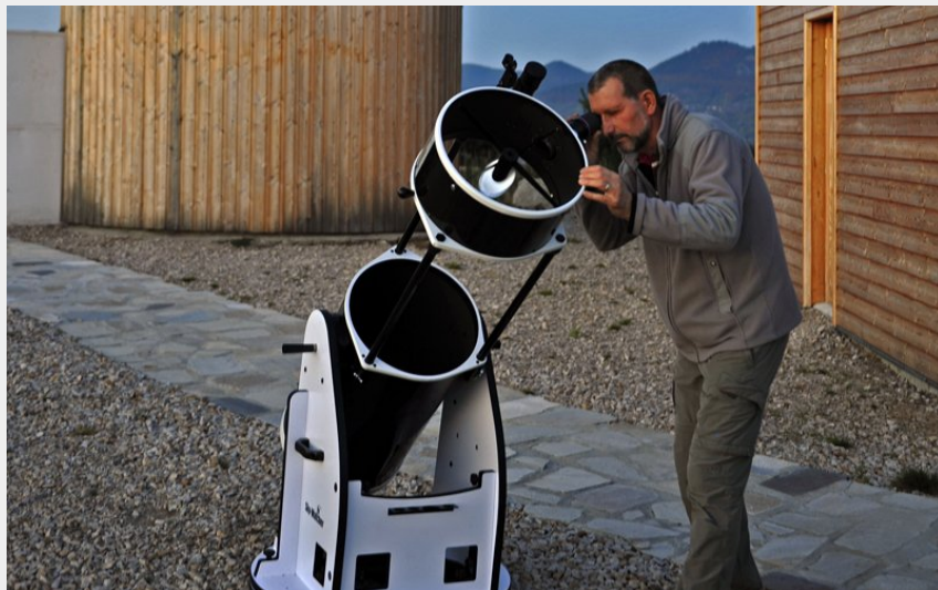
Observatoire du Betz (Ch. Bertholet)