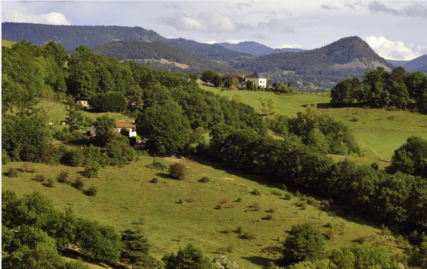
La Huche pointue (Christian Bertholet)