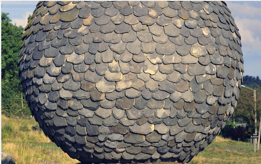
La sphère de Lauzes de Pailhaires (Christian Bertholet)