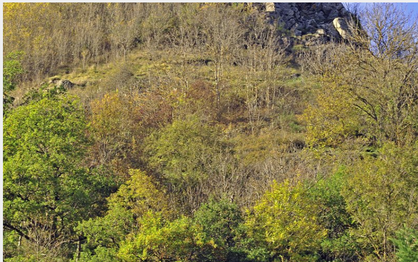
Pic de Mercœur (Christian Bertholet)