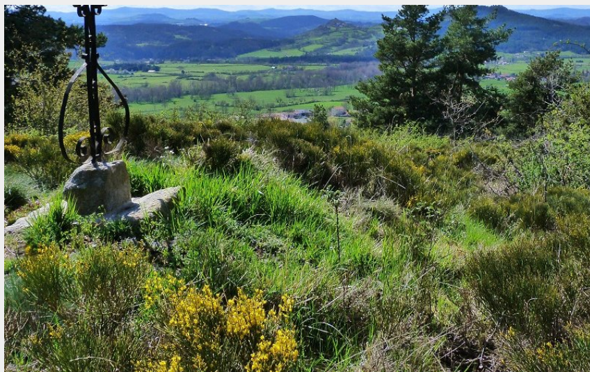
Vue depuis les Suchas (Claude Bruyère)