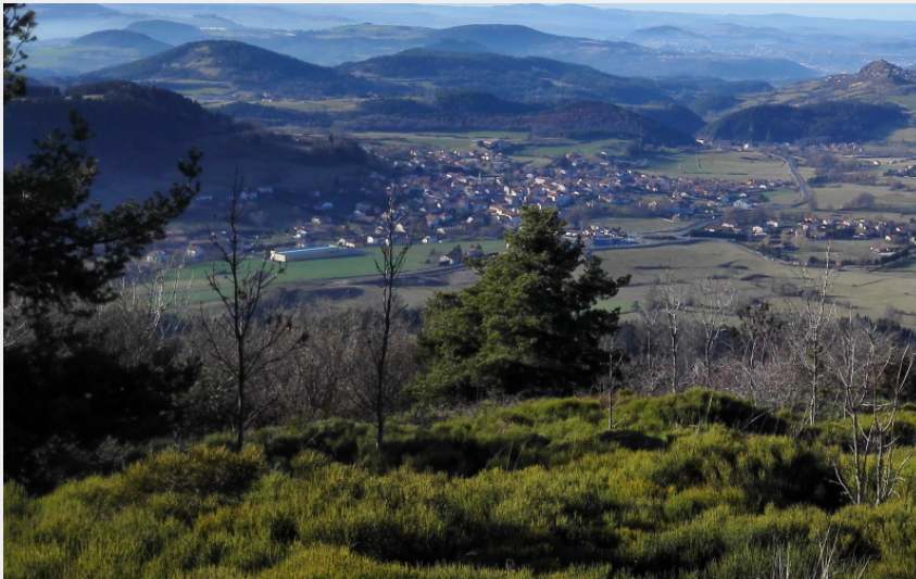
Vue sur Lantriac (Mairie de Lantriac)